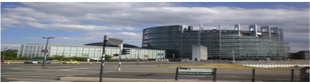
Parlamento Europeo a Strasburgo.