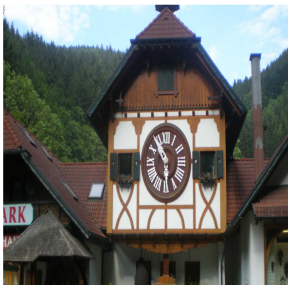
Schonach (2^ orologio a cucu' piu' grande al mondo) Schonachback (1^ orol. a cucu' piu' grande al mondo)