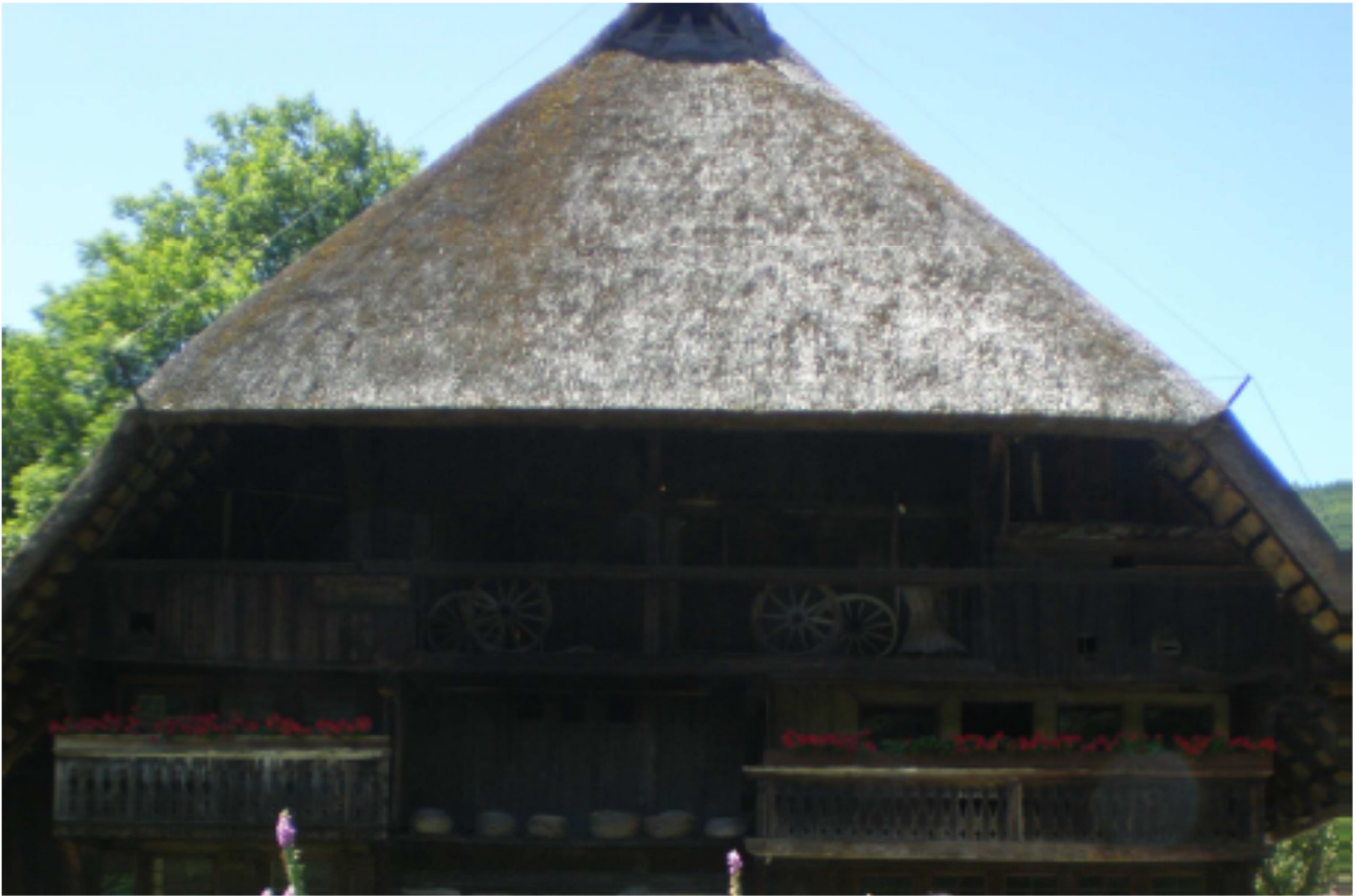
Tipica abitazione nel museo all'area aperta di Gutach