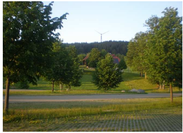
Area di sosta Schonach